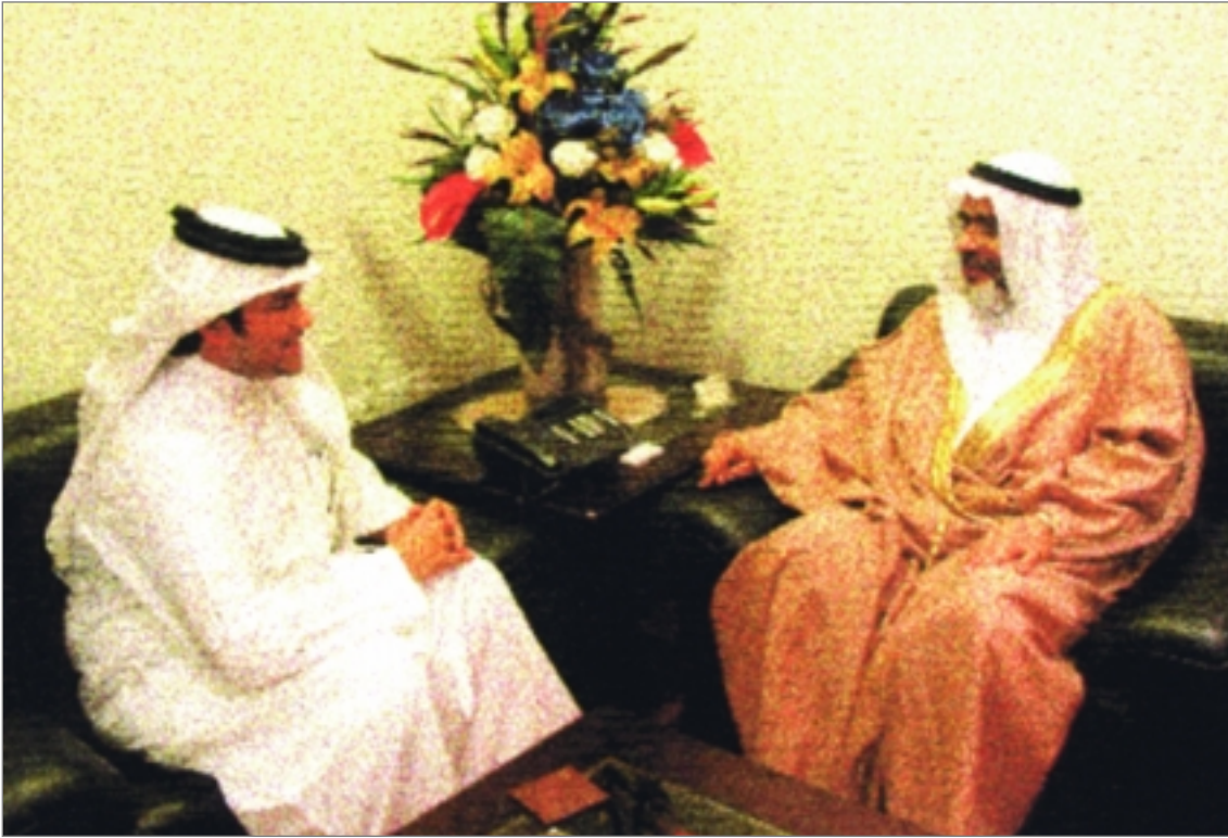
صندوب "صوت الجامعة" يحاور رئيس مجلس النواب