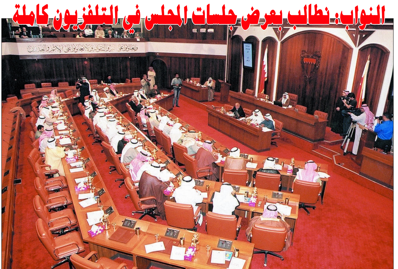
جانب من جلسات مجلس النواب

أنهم اتفقوا في شيء واختلفوا في آخر ولكن يبقى الشيء المشترك هو مصلحة الوطن وأن المجلس هو أحد مظاهر الديمقراطية.