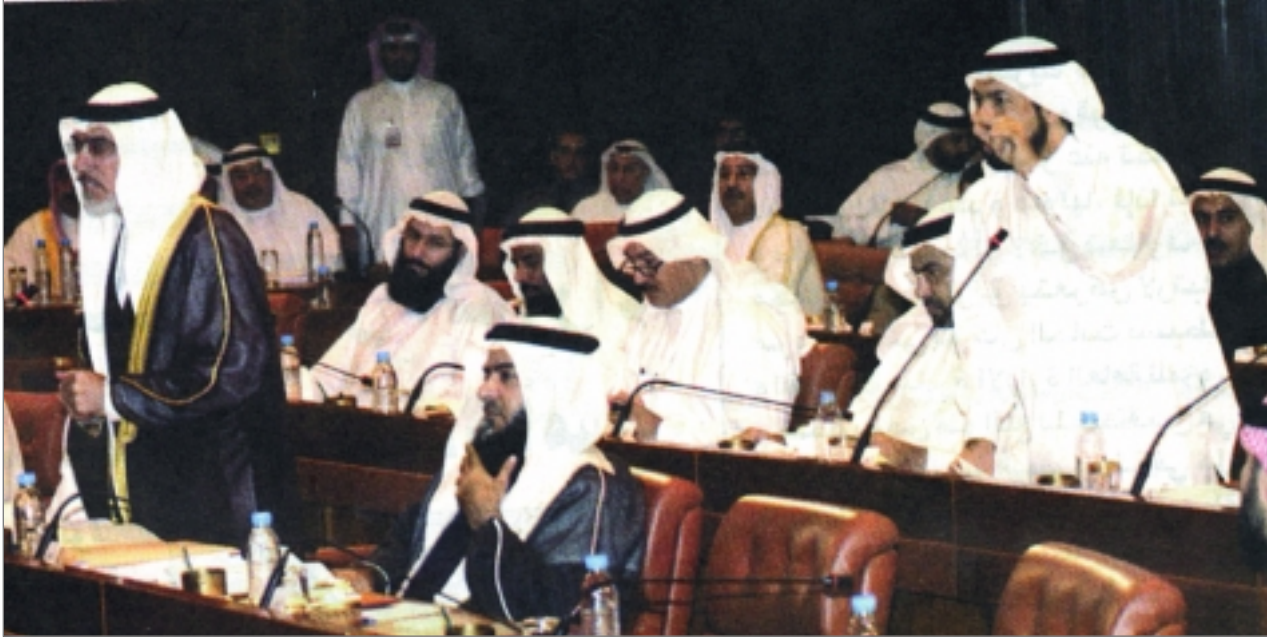
تضامياً للمرأة في مناقشات النواب