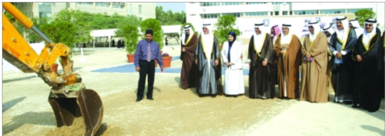
وضع حجر أساس المركز الاعلامي