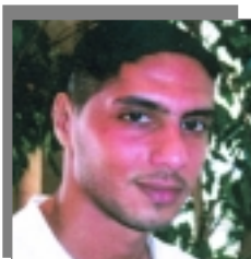
سالمين والاحتراف في الخسارح