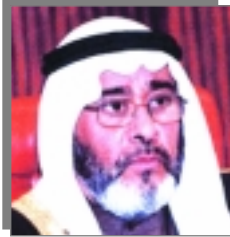
في ملف العدد: مجلس النواب