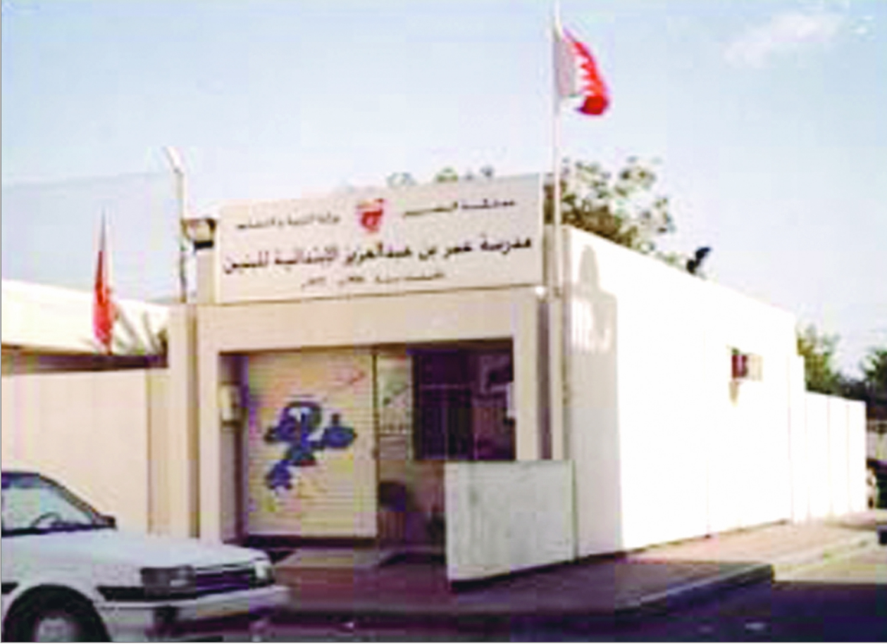
إحدى المدارس الحكومية

ماذا يفعل الأب الذي يريد التعليم الجيد لابنة؟ هل يدخله المدرسة الخاصة بحجة أن اللغة بها قويه أم يدخله المدرسة الحكومية لأنها تعتمد على اللغة الأم؟ وما هو حال أبنائنا الطلبة في المدرستين هل كان أولياء الأمور محقين في إلحاقهم بالمدارس الخاصة بحجة التحدث باللغة الأجنبية بكل طلاقة أو أن يعتمدوا على المدارس الحكومية لتأمين مستقبل واعد. ويظل أولياء الأمور أمام السؤال الحائر أيهما أفضل المدارس الحكومية أم الخاصة؟؟؟