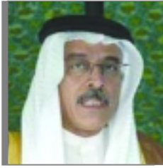
المركز الإعلامي الجديد