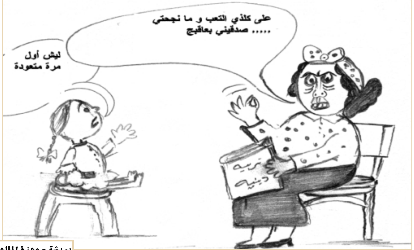
بريشة - موزة المالود