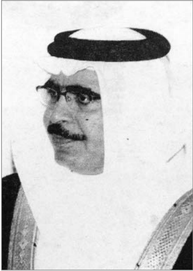
الشيخ راشد آل خليفة وزير الداخلية

مركز دراسات المواصلات والطرق، كلية الهندسة - جامعة البحرين، بالإشتراك مع : للجنة العامة للسلامة على الطريق.