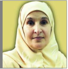
رئيسة الجامعة تفتتح معرض المهن السادس