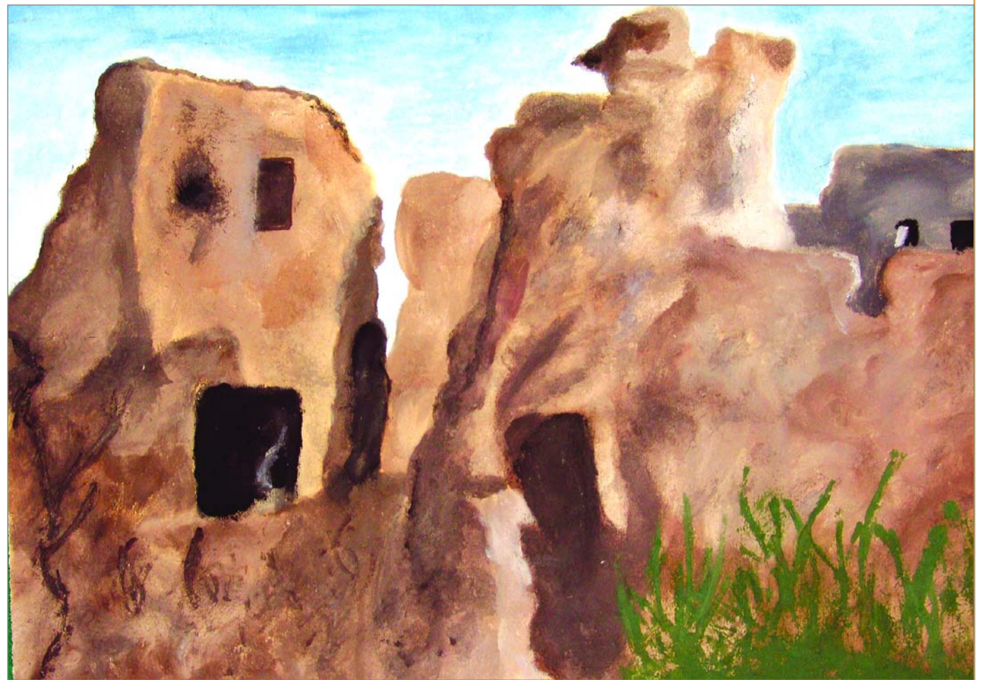
موضوع اللوحة: من بيوت البحرين القديمة - بريشة عائشة البوعيينين - مقرر ١٤١ فنون - إشراف: د. سامية إنجنير

بكلية الآداب - جامعة البحرين المراسلات: جامعة البحرين - قسم الإعلام والسياحة والفنون - ص.ب: ٣٢٠٢٨ مملكة البحرين - فاكس: ١٧٤٤٩٦٥٥ تليفون: ١٧٤٣٨٤١٣ - ١٧٤٣٨٤٠٤