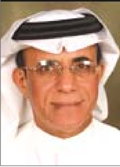
عبد الحميد القائد:

لقد استغربوا منا نحن القادمين من الصحراء، الغارقين في بحور النفط والقصور والسيارات الفارحة - حسب رأيهم طبعاً - أن نكتب شعراً عصرياً يحمل كل هذا الإبداع والهم الإنساني، وكل هذا الألم الذي بوسعه أن يحرق حتى البحر، حدثتهم عن دلمون وعن جلامش وعن أرض الخلود التي ازدهرت لتصبح ميناءً للعالم كله، حدثتهم عن لؤلؤ أوائل النفيس الذي اغتصبه النفط لكنه ظل يتلألأ في نفوس الشعراء، قلت لهم لست وحدي هنا فأنا مجرد شاعر بسيط في قائمة طويلة من الشعراء