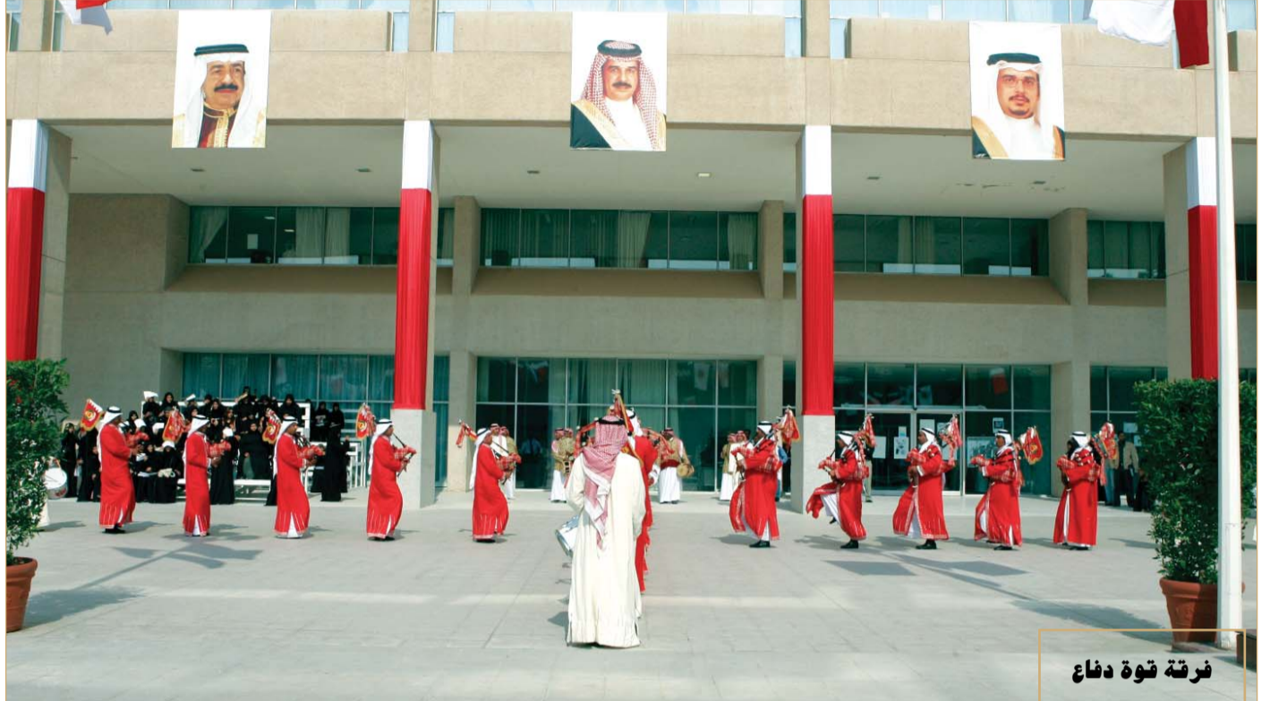
فرقة قوة دفاع البحرين تشارك الجامعة الاحتفالات بالعيد الوطني الجيد

كلية الآداب - جامعة البحرين المراسلات: جامعة البحرين - قسم الإعلام والسياحة والفنون - ص.ب: ٢٢٠٢٨ مملكة البحرين - فاكس: ١٧٤٤٩٦٥٥ تليفون: ١٧٤٣٨٤١٣ - ١٧٤٣٨٤٠٤