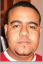
بقلم : عبدالله علوي