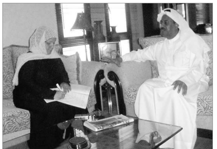
أثناء المقابلة مع مندوبة «صوت الجامعة»

مقوماتنا السياحية تعتمد على التاريخ والموارد الطبيعية مثل العيون والبحار والشواطئ، وهي مقومات أساسية لترويج منحة السياحة. وكذلك البرامج التي تطرحها الدولة وتعمرها من بنى تحتية يتم من خلالها تحقيق ما في الأذهان من مشروعات. ولدينا منحنى آخر وهو تقريب العوائل العربية والأجنبية التي تتمتع بأماكن ترفيهية ومن مشروعات وحفلات متنوعة وفنادق جيدة تجعل الناس أكثر إقبالا على زيارة البحرين.