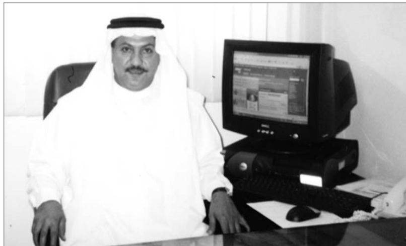
كتبت: فاطمة إبراهيم قسم الإعلام والسياحة والفنون

وستقوم اللجان العاملة في المؤتمر بتسويق معرض ألمنيوم الشرق الأوسط في كل أنحاء العالم بالإعلان عنه في المجالات الترويجية، وبالرسائل البريدية والإلكترونية لأكثر من ٦٠٠٠ شركة لها علاقة بقطاع الألمنيوم بالإضافة إلى الترويج للمعرض في خلال الفعالية العالمية (ألمنيوم ٢٠٠٤) في مدينة «أسن» بألمانيا من خلال موقع خاص بالمعرض على شبكة الإنترنت؟