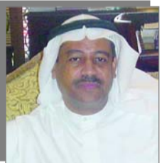
مستقبل السياحة في البحرين