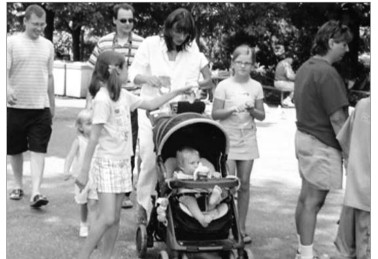
عائلة أمريكية أثناء تجولها في إحدى الحدائق