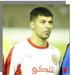
إستعدادات المنتخب الوطني لكأس العالم