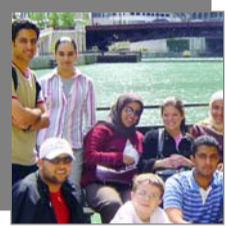
طلاب الإعلام في شيكاغو (ملف العدد)