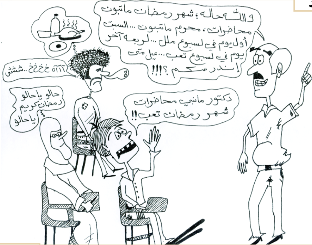
بريشة - بدر الحاج