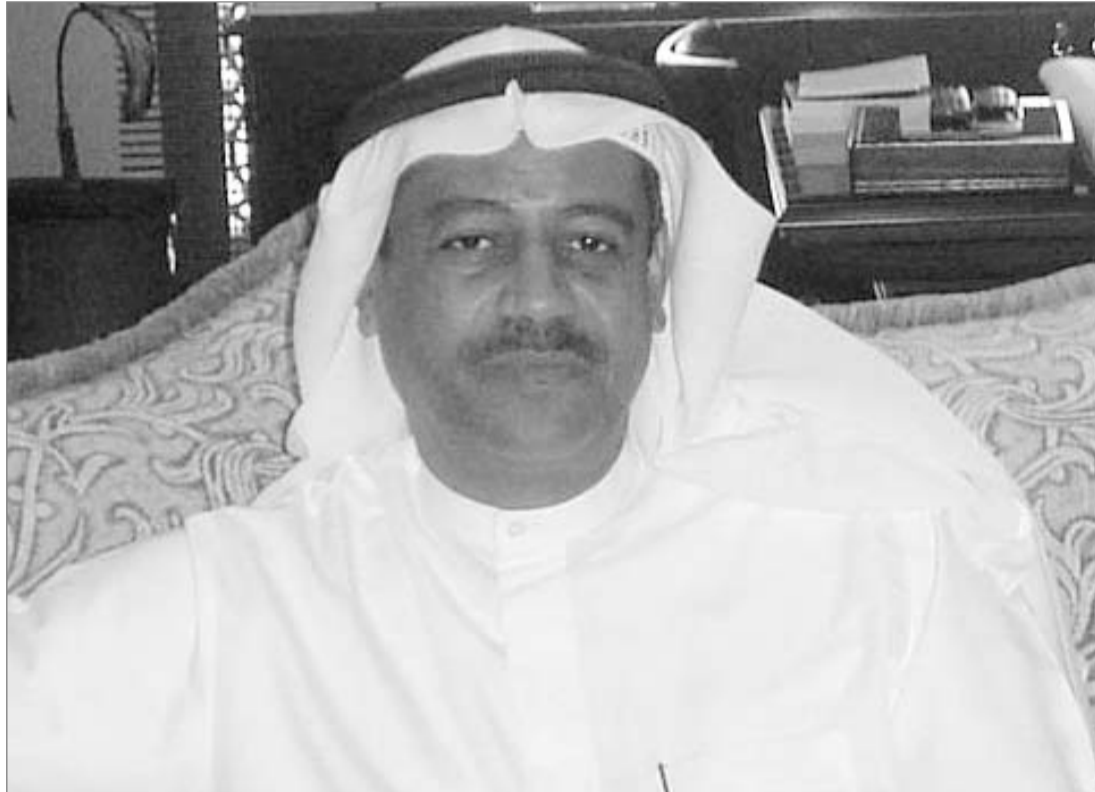
أ. مبارك العطوي الوكيل المساعد لشئون السياحة - وزارة الإعلام