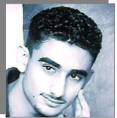
إبداعات أدبية بأقلام طلابية