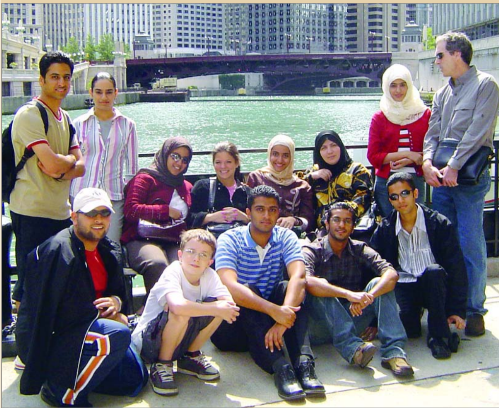
صورة جماعية للطلبة المشاركين في الرحلة

بعد رجوعهم إلى البحرين، وانتهاء «موسم الهجرة إلى شمال شيكاغو»، عادوا محملين بروى وطموح إعلامي لا محدود يقصد التغيير والبناء، والاستفادة مما تعلموه وجربوه.