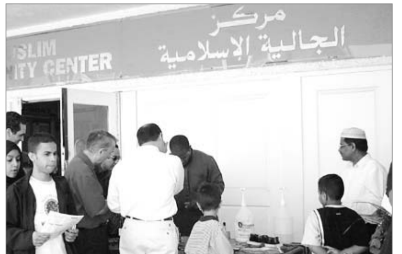
جانب من مركز الجالية الإسلامية في شيكاغو Muslim Community Center