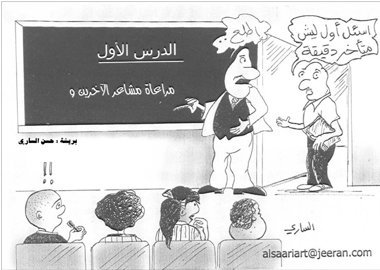
بريشة : حسن الساري