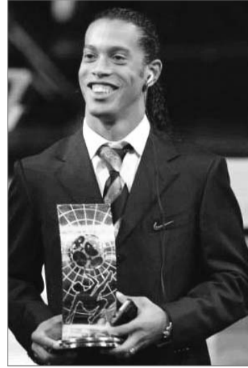
كتب - عبد الله علاوي

من المديرين على مهاراته العالية التي استطاع بفضلها قيادة البرازيل للفوز بكأس القارات الأخيرة، كما ان ديفرتيفو و اتليكو مدريد رغم نتائجهم المخيبة على مر المواسم الماضية يأمل المراقبون ان يعودوا عبر هذا الموسم ليتبوؤوا مراكزهم التي يستحقونها . باقي الفرق سيكون لها حضور كذلك هذا